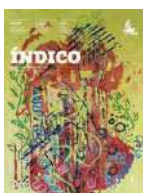
CAPA || COVER JÚLIO MARCOS PINTURA || PAINTING GÉSSICA STAGNO